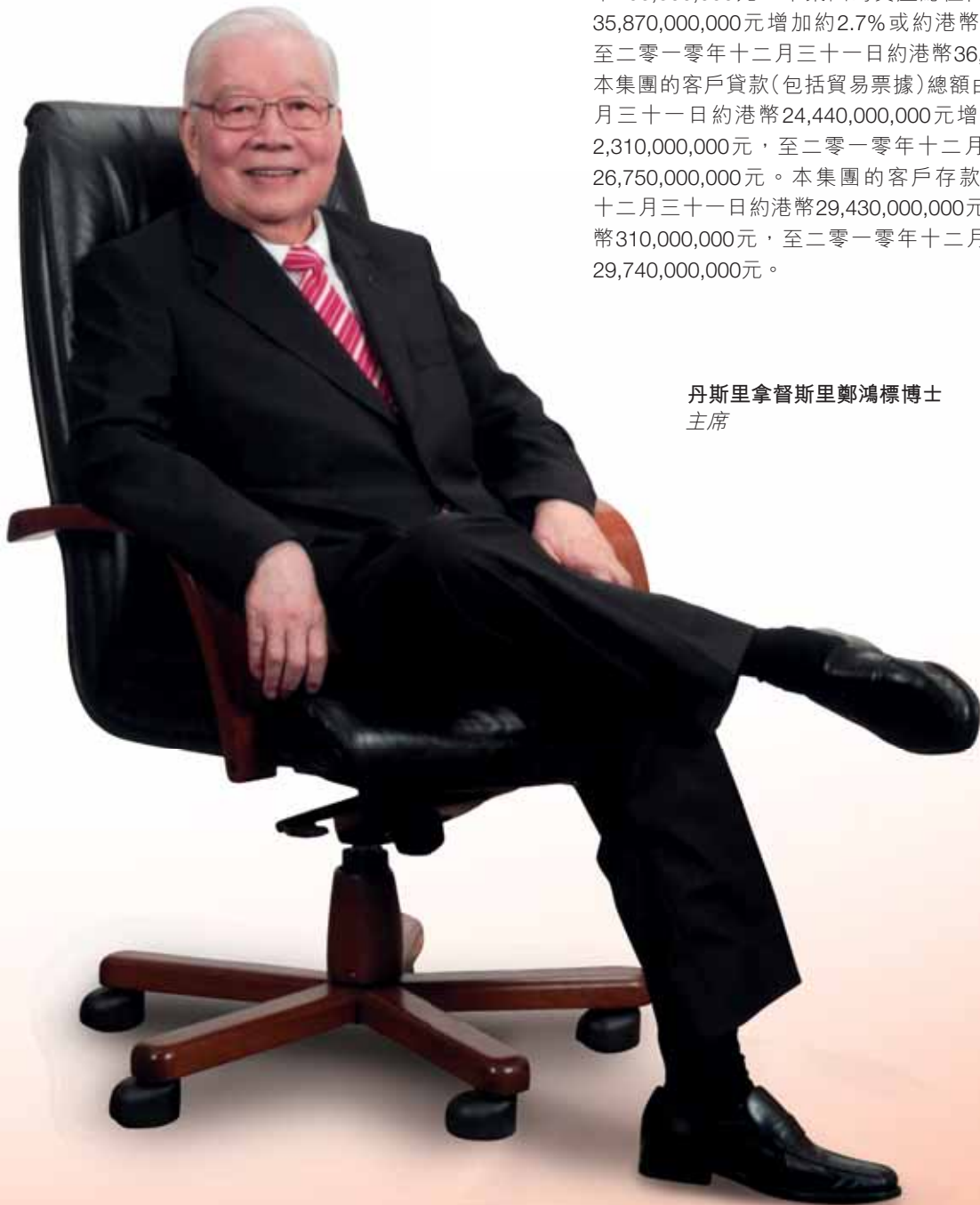
丹斯里拿督斯里鄭鴻標博士 主席

本集團截至二零一零年十二月三十一日止財政年度的除稅後溢利大幅增加83.6%或約港幣206,600,000元，至約港幣453,800,000元。本集團的資產總值由去年年底約港幣35,870,000,000元增加約2.7%或約港幣980,000,000元，至二零一零年十二月三十一日約港幣36,850,000,000元。本集團的客戶貸款(包括貿易票據)總額由二零零九年十二月三十一日約港幣24,440,000,000元增長9.5%或約港幣2,310,000,000元，至二零一零年十二月三十一日約港幣26,750,000,000元。本集團的客戶存款亦由二零零九年十二月三十一日約港幣29,430,000,000元增長1.1%或約港幣310,000,000元，至二零一零年十二月三十一日約港幣29,740,000,000元。