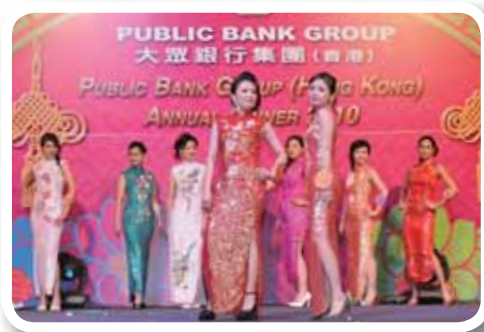
大眾銀行集團(香港)小姐參賽佳麗出席週年晚宴。