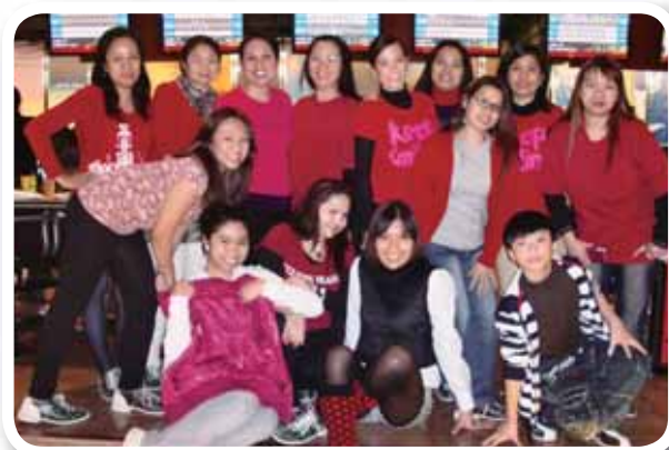
二零一零年社際聖誕保齡球大賽的選手們。