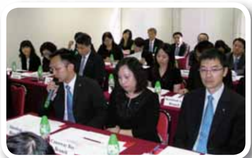
分行經理及業務單位主管熱烈參與業務對話。