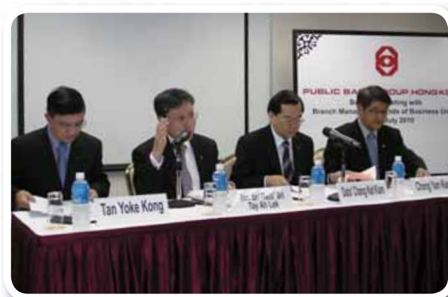
馬來西亞大眾銀行之高級管理層於二零一零年七月到訪大眾銀行(香港)時與業務單位主管及分行經理進行業務對話。