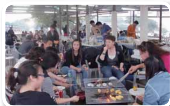
於二零一零年十一月舉辦「燒烤及高爾夫同樂日」，員工在白石高爾夫球練習場歡渡了一天。