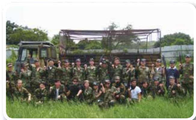
二零一零年十月舉辦野戰活動，戰士們在作戰前合照留念。