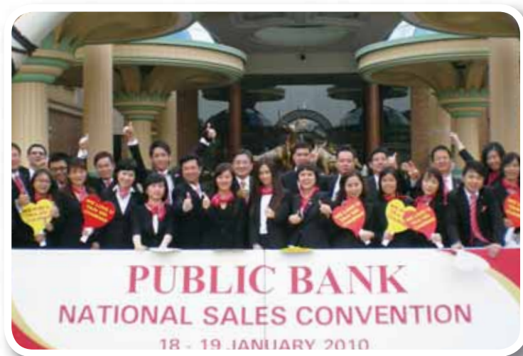
「大眾銀行二零一零年全國銷售會議」於二零一零年一月假馬來西亞Sunway Lagoon Resort Hotel 舉行，出席的職員在會場外拍攝團體照。