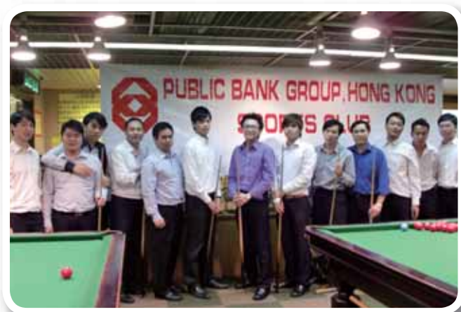
本集團康體會於二零一零年七月舉辦社際桌球大賽，圖為一班參賽健兒。