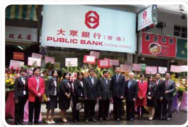
二零一零年六月大眾銀行(香港)粉嶺分行慶祝喬遷之喜。