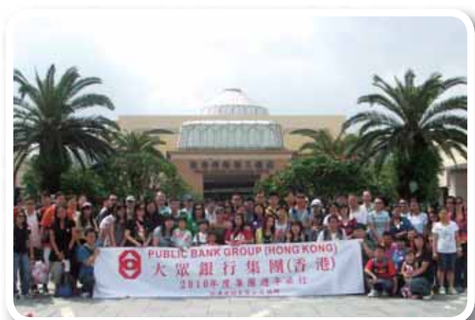
二零一零年度集團週年旅行，員工及家眷暢遊了中國珠海市海泉灣渡假村。