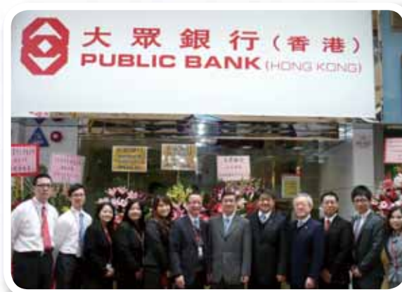
大眾銀行(香港)的大角咀分行於二零一一年一月隆重開業。