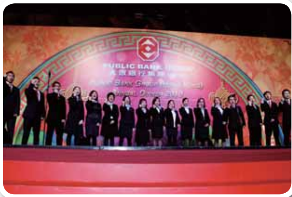
本集團的合唱團在二零一零年週年晚宴上獻唱大眾銀行之歌。