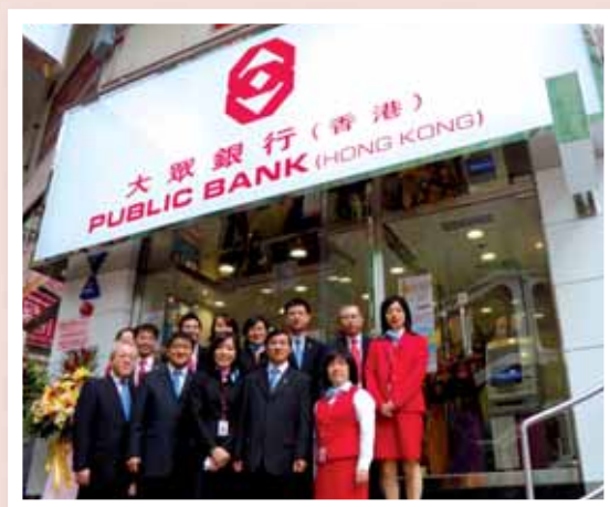
於分行開業時員工於鯽魚涌分行之團體照。