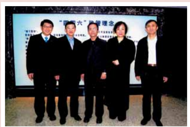
本行高級管理層於二零零九年十月拜訪中國銀監會瀋陽辦事處。