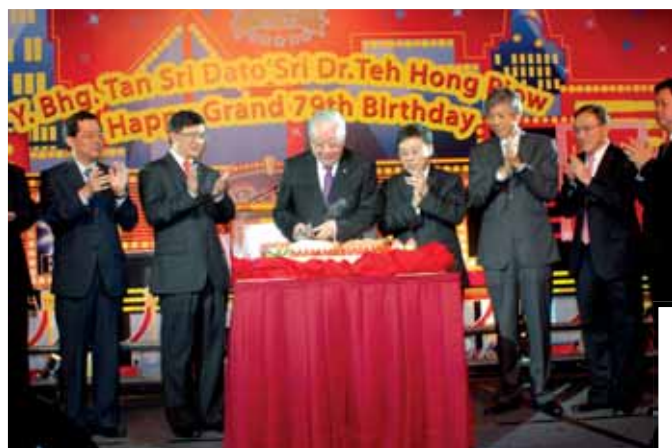
本集團主席丹斯里拿督斯里鄭鴻標博士於香港慶祝79歲壽辰，由其他董事會成員陪同下切生日蛋糕。