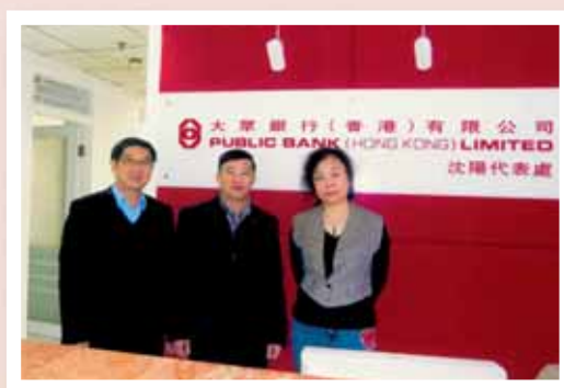
執行董事於二零零九年十月到訪大眾銀行（香港）瀋陽辦事處。