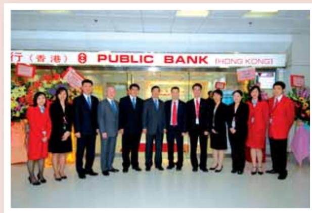
大眾銀行（香港）第30間分行－沙田分行於二零零九年六月開業。