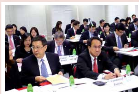
分行經理及業務單位主管熱烈參與業務對話。