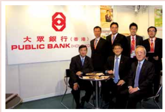
高級管理層到訪設於香港會議展覽中心中小企業國際推廣博覽會之大眾銀行（香港）展位。