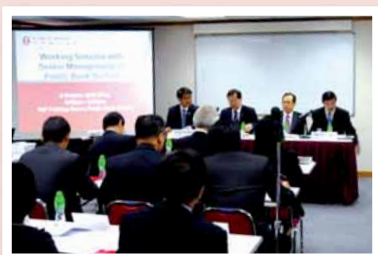
馬來西亞大眾銀行之高級管理層於二零零九年十月到訪本行時與業務單位主管及分行經理進行業務對話。